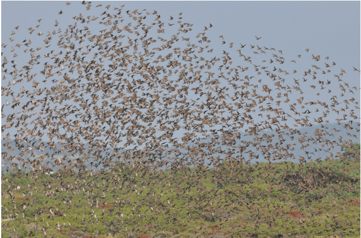
Balgö - Starflock i augusti.

Ett fågelskyddsområde med beträdnadsförbud finns på den sydöstra delen av ön där man också har anlagt våtmarker. Sälskyddsområde finns på öarna väster om Balgö. Många roliga arter är sedda på Balgö som t.ex. svartvingad glada, ökenstenskvätta, brednäbbad simsnäppa, större pipjärka och på senare år stora flockar med övervintrande berglärkor (över 90 ex!). Mitt roligaste fynd är en skedstork i april 2015.