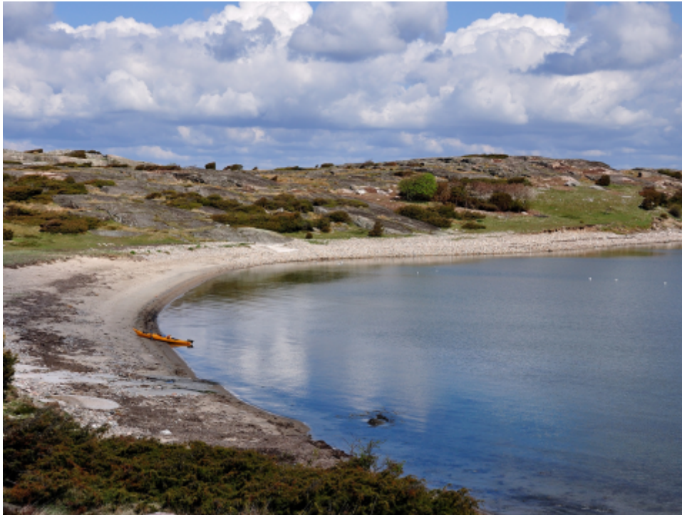
Gott om plats för kajaker i viken på Nordsten (4).

Jämför man med Balgö så är det färre rariteter rapporterade från Vendelsöarna och det som sticker ut är höstfynd av svartpannad törnskata och taigasångare. Sena vår- och sommarfynd av jorduggla kanske också kan kittla nyfikenheten. Mellan Ustö och Nordsten är det goda chanser att stöta på knubbsäl. Jag bedömer att både Vendelsö och Balgö är underskådade och det finns säkert saker att upptäcka här under vår och höst om bevakning vore bättre. Kanske satt det en tornuggla i Vendelsös hättkevarn från 1876 när flödet från Danmark gav tornuggleobsar utefter västkusten våren 2021?